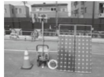
▶ P. 9