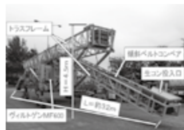
縦取り機全景(前方) ▶ P.13