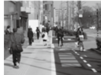
供用済みの区間の様子(下り側) ▶ P. 5