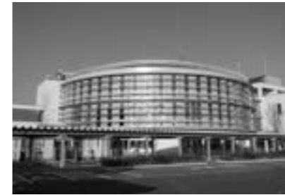
■新潟市こども創造センター（新潟県新潟市中央区）

新潟市こども創造センターは、未来を担うこどもたちが、多くの人々との交流やさまざまな創作活動・体験活動を通して、「自ら生きる力」を伸ばし、「共に生きる力」を育むための機会と場を提供する施設として、平成25年5月25日にオープンしました。施設には、本格的な創作活動ができる「ものづくりひろば」や、光や音を使った造形活動を行うことができる「光と音のホール」、大型遊具で冬でもこどもたちが体を動かして遊ぶことのできる「あそびのひろば」などが設けられています。