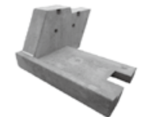
小口止(隔壁)基礎一体型ブロック ▶ P.25

「北陸の建設技術」への意見、ご感想がありましたらお聞かせください。 E-mail:hokugi@hrr.mlit.go.jp