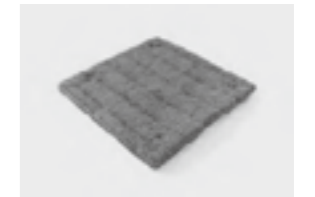
コケマット（陸屋根・地上など）