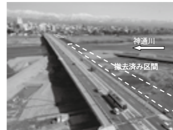
H26年3月の状況 ▶ P. 7