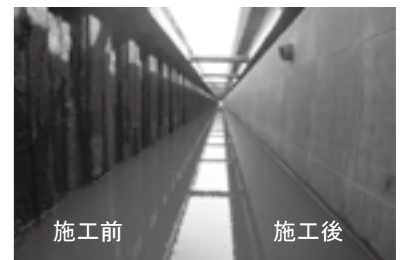
施工前 施工後 施工前・施工後の状況 ▶ P.25